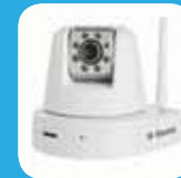
Draadloze Pan/Tilt colour camera