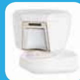
Superieure buitendetector met anti-masking